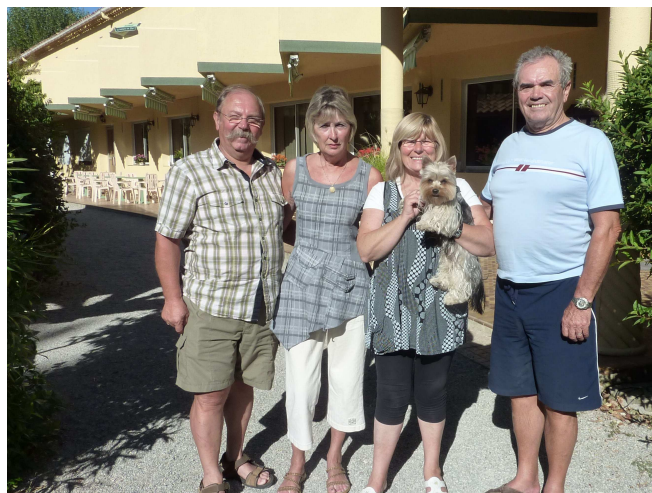
02) Séjour touristique à l'Hôtel Sous l'Olivier de Buis les Baronnies pour joindre l'utile à l'agréable.