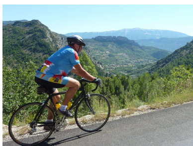
04) Mais aussi les superbes Gorges de la Nesque.