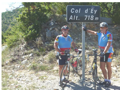
03) En guise d'entraînement, le col d'Ey, en Provence.