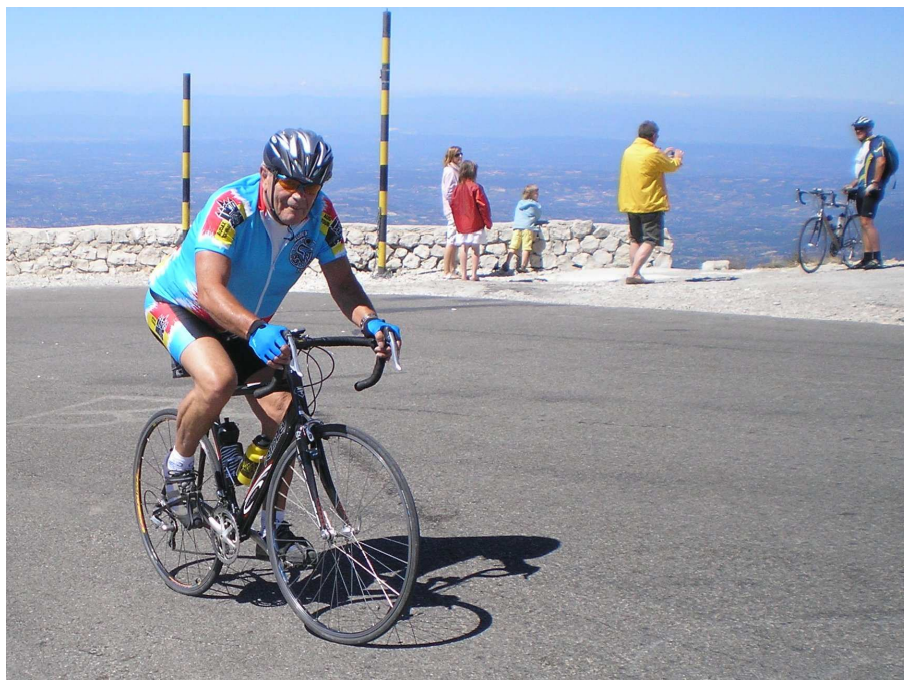
06) Et puis, déjà, 6 km après le Chalet Reynard, l'arrivée au sommet !